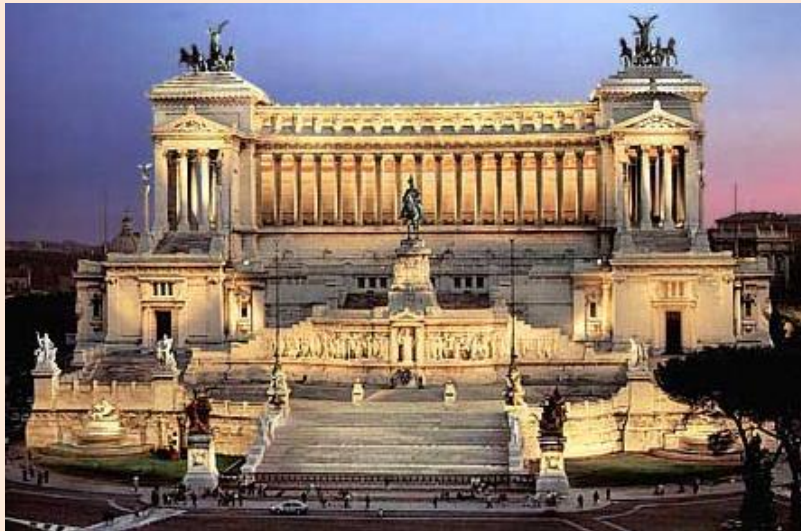
Monumento ao herói desconhecido

Em 1933 encontramos uma figura ética. Tudo isso muito antes de que qualquer governo demonstrasse alguma posição. Desde então, a cada Congresso, esses padrões éticos têm sido uma diretriz de trabalho que seguimos no PEN. Eu penso que a forma de conduzir com liderança e virtude em Dubrovnik, como adotou Wells, foi a forma adequada para entender a ética do PEN. Foi um momento nobre para ele e para o PEN.